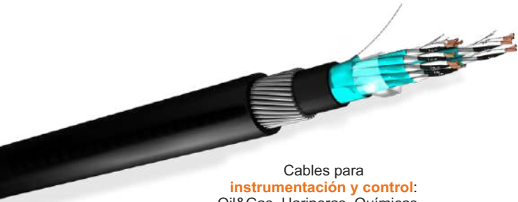
Cables para instrumentación y control: Oil&Gas, Harineras, Químicas...