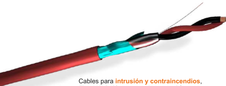
Cables para intrusión y contraincendios, libres de halógenos, resistentes al fuego...