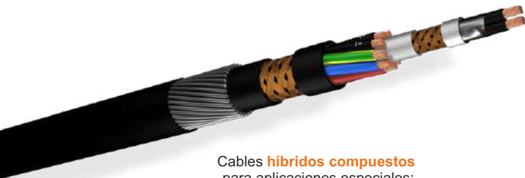
Cables híbridos compuestos para aplicaciones especiales: video, control, señales...