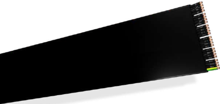
Cables extraflexibles: grúas, ascensores, robótica...