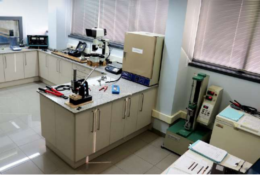
Laboratorio de Control de Calidad en la fábrica de CEUCABLE