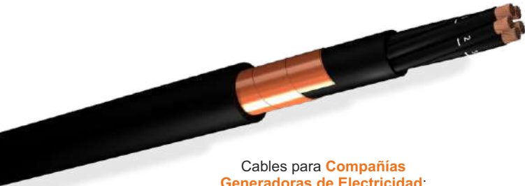
Cables para Compañías Generadoras de Electricidad: Endesa, Red Eléctrica, Iberdrola...