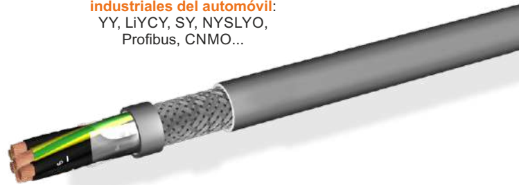
Cables control para instalaciones industriales del automóvil: YY, LiYCY, SY, NYSLYO, Profibus, CNMO...