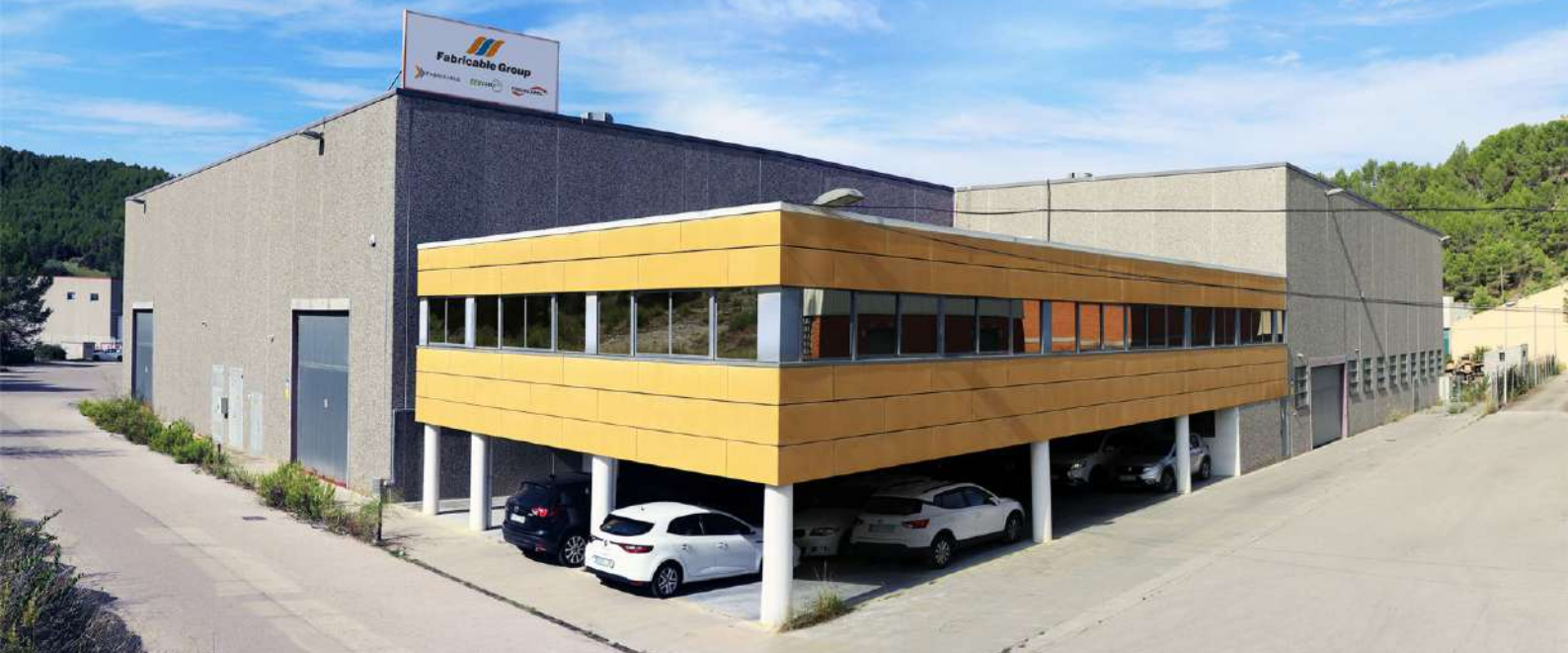
Fotografías: fábrica de CEUCABLE en Sant Vicenç de Castellet